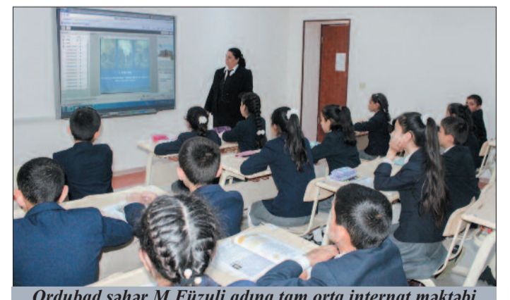
Ordubad şəhər M. Füzuli adına tam orta internat məktəbi

Əliyevin "Kitabi-Dədə Qorqud"un alman dilinə ilk tərcüməsi və nəşrinin 200 illiyinin qeyd edilməsi haqqında" 2015-ci il 20 fevral tarixli Sərəncamından da bəhs edib.